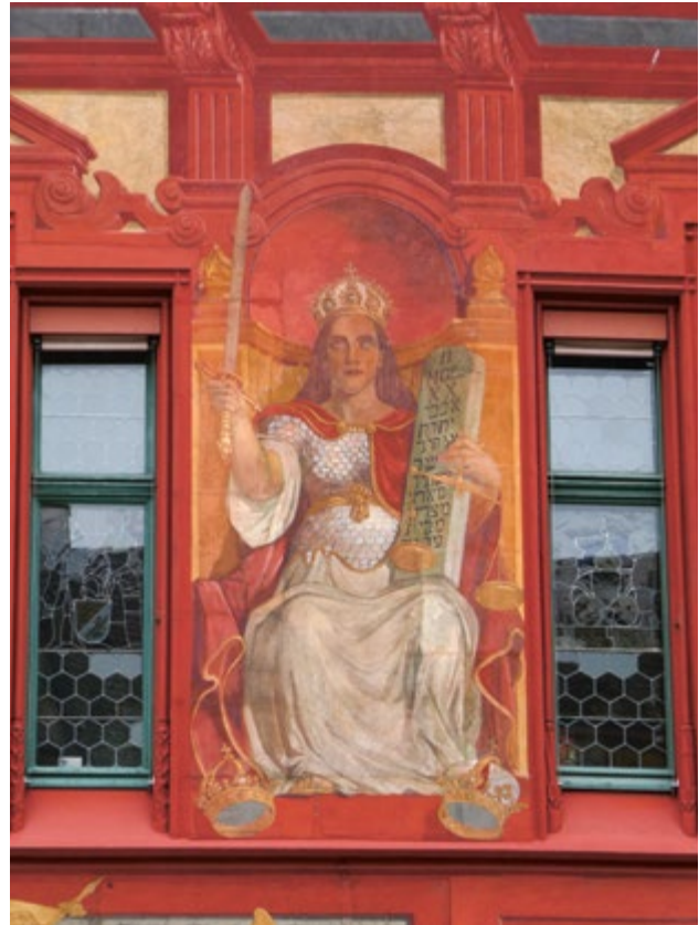
Gemälde am Rathaus von Basel

«Offenem Unrecht soll man wehren», liess Bruder Klaus in seinem Dankesbrief an die Ratsherren in Bern schreiben. Auch verfehlte Gesetze und Anordnungen können offenes Unrecht sein, dem es zu wehren gilt. Auslegungen von Römer 13, die in Richtung Idealisierung des Staates gehen, tun uns dabei keinen guten Dienst.