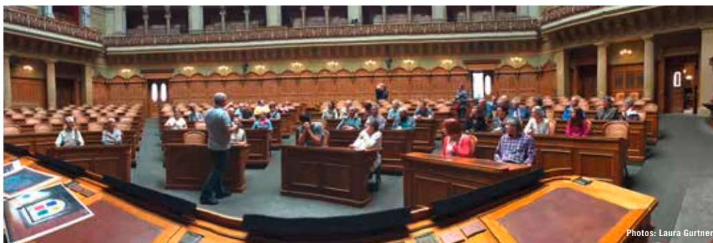
«Assis tels des conseillers nationaux...»